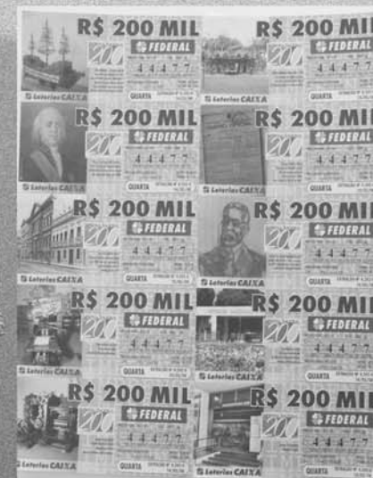
Frações do bilhete da Loteria Federal com imagens históricas relacionadas à Imprensa Nacional Homenagem da Caixa