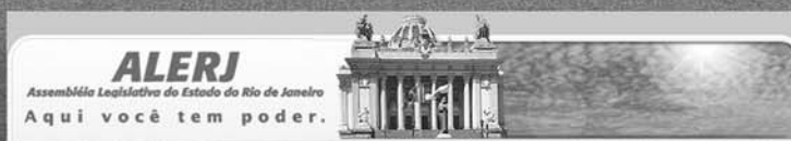
Sessão Solene Extraordinária da Assembleia Legislativa do Estado do Rio de Janeiro Dia 20 de maio de 2008, às 18h 30min