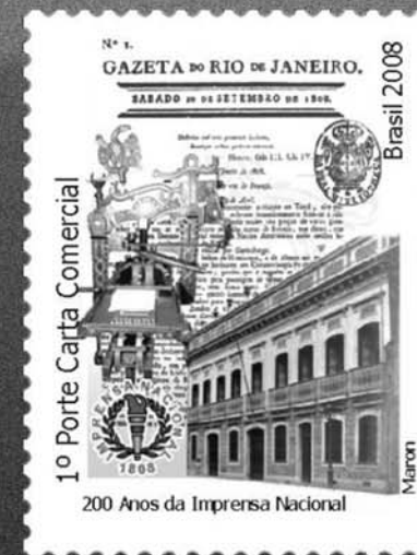
Selo lançado pelos Correios trazendo a sede da Imprensa Régia no Rio de Janeiro, em primeiro plano e, ao fundo, o exemplar nº 1 da Gazeta do Rio de Janeiro