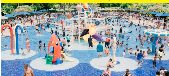
Dia das crianças no CFL - Pág. - 3

“Educar é impregnar de sentido o que fazemos a cada instante” Paulo Freire