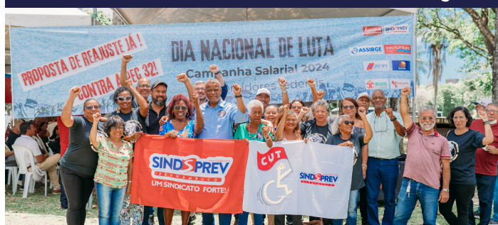
Plenária dos Servidores Públicos - Pág. - 4